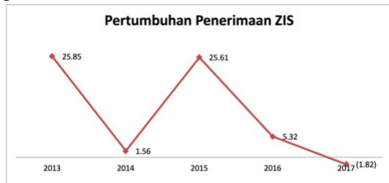
Gambar 2. Pertumbuhan Dana ZIS Yang Dihimpun oleh BAZNAS Kota Mataram Tahun 2012 – 2017.

pada tahun 205 – 2017 terus mengalami penurunan hingga mencapai negatif 1,82 persen.